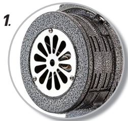
1. ตัวไซเรนทำจากเหล็ก แข็งแรงทนทาน