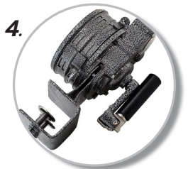
4. ขนาดพกพาสะดวก พับเก็บได้