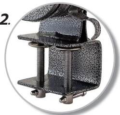
2. รุ่น LK100B ติดตั้งใช้งาน โดยการยึดกับโต๊ะ